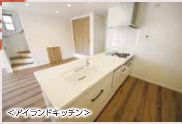
<アイランドキッチン>