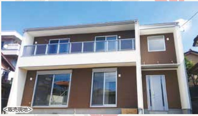
<販売現地> <イメージパース>