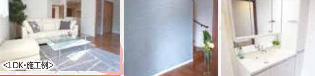
<LDK・施工例> 広々LDK 17.3帖 <玄関+アクセントクロス> <洗面台>

Life Information ■夏見第二保育園 .....徒歩6分(約480m) ■長津川親水公園 .....徒歩3分(約240m) ■夏見台小学校 .....徒歩9分(約720m) ■ヨークマート .....徒歩3分(約240m)