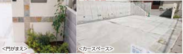
<門がまえ> <カースペース>